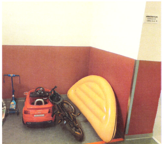
E18A vån 5