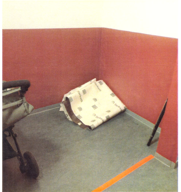
E18A vån 4