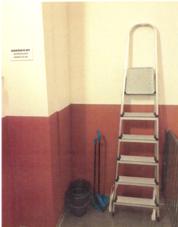
E18A vån 3