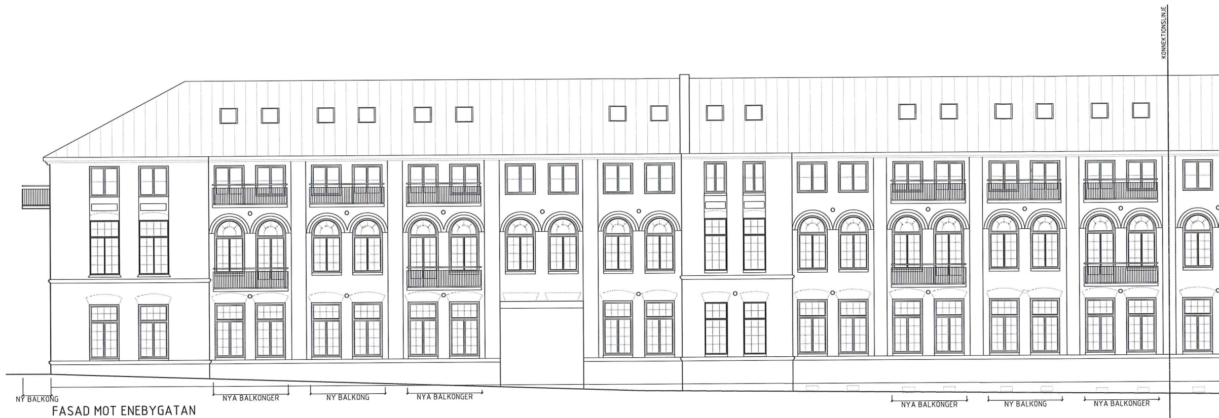
FASAD MOT ENEBYGATAN