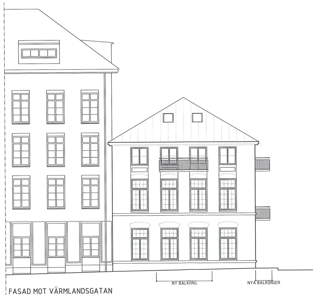
FASAD MOT VÄRMLANDSGATAN